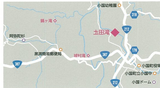
所在地：熊本県阿蘇郡小国町黒淵